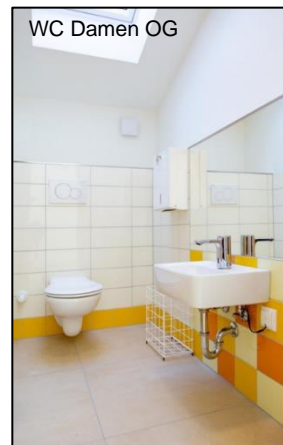
WC Damen OG