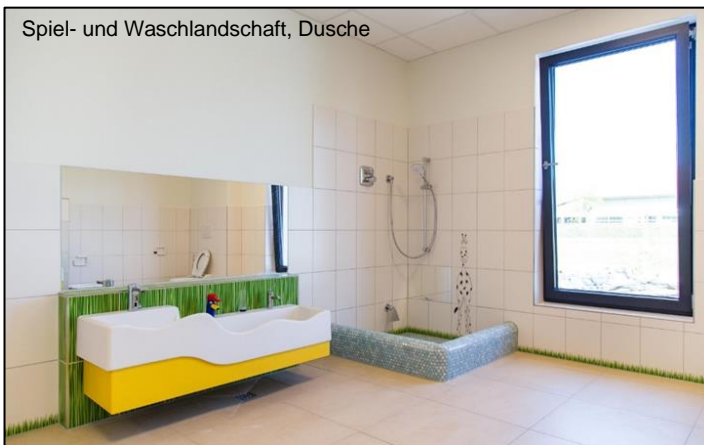
Spiel- und Waschlandschaft, Dusche

Die Einzelraumlüfter in den WCs werden über Präsenzmelder angesteuert, im Pumi- und im Vorratsraum sind Intervallsteuerungen installiert.