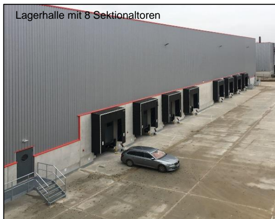
Lagerhalle mit 8 Sektionaltoren

Die Büroräume und die Halle sind mit einer energiesparenden LED-Grundbeleuchtung ausgerüstet. Der Fahrradstand wurde mit Lademöglichkeiten für E-Mobilität vorgerüstet.