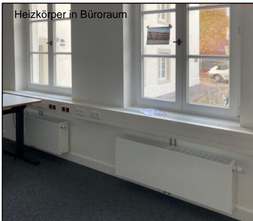
Heizkörper in Büroraum

Im Dachgeschoss wurde eine Multisplit-Klimaanlage mit hocheffizienter Inverter-Technologie eingebaut. Sie besteht aus einem Außengerät und vier Wandgeräten mit Infrarot-Fernbedienung.