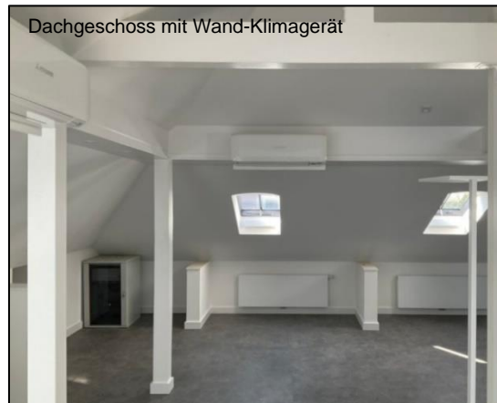
Dachgeschoss mit Wand-Klimagerät